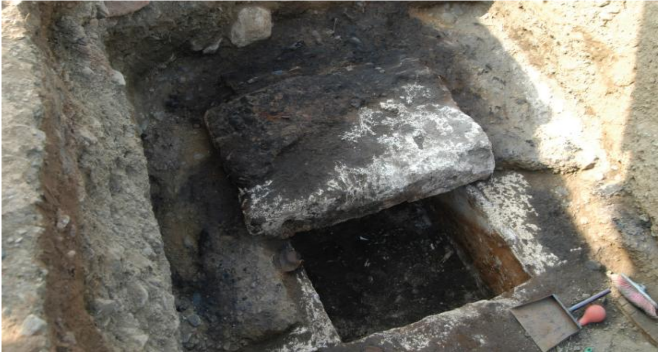
Ανασκαφή στο νεκροταφείο

Πολλοί τύμβοι κάλυπταν ταφές της υστεροκλασικής και ελληνιστικής περιόδου. Τα κτερίσματα των τάφων αυτών είναι συνήθως απλά αγγεία, σιδερένια όπλα και λιγοστά μικροαντικείμενα, καθώς πρόκειται για ταφές ανθρώπων από χαμηλά κοινωνικά στρώματα. Οι πλούσιοι της περιόδου αυτοί θάβονταν σε κτιστούς τάφους, όπου τοποθετούσαν πολύτιμα κτερίσματα (χρυσά, ασημένια και χάλκινα κοσμήματα και αγγεία). Οι τάφοι αυτοί έχουν βρεθεί συλημένοι ήδη από την αρχαιότητα.